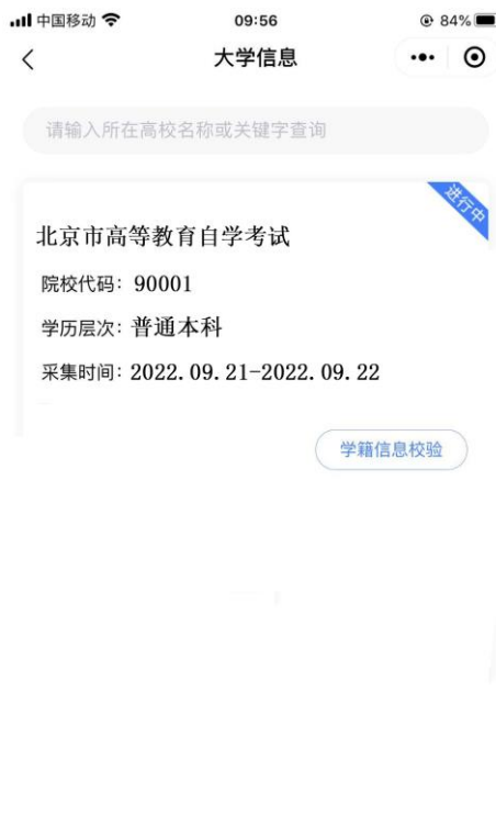
选择相应的学历层次

3. 选择相应的学历层次，进入校验信息页面，输入姓名、证件号码并授权微信联系电话