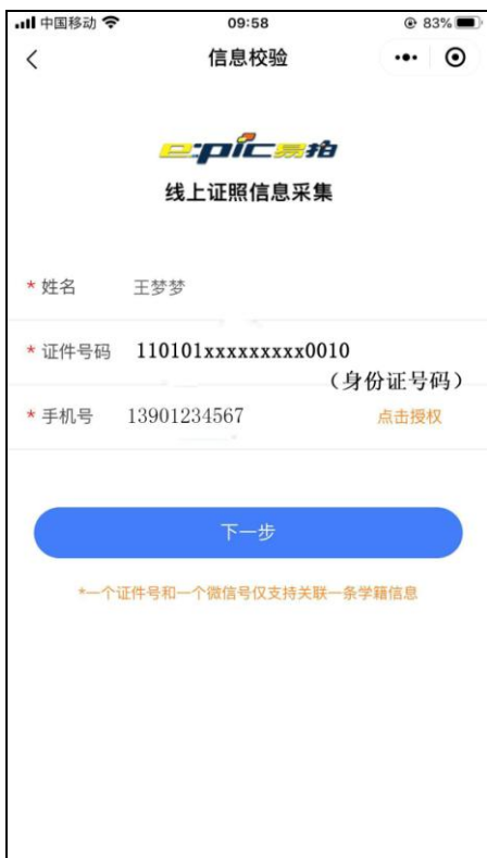
输入完整信息（证件号码为身份证号码）