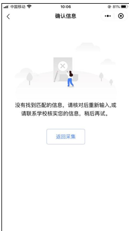
信息无法确认页面