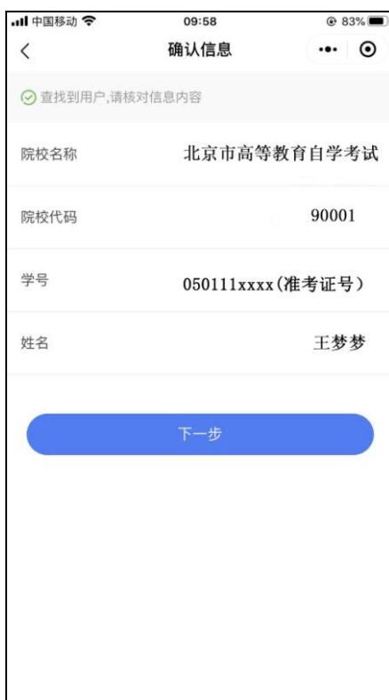
确认信息（学号为准考证号码）